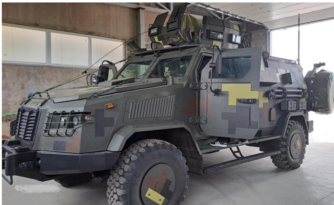
Рисунок 1 Спеціальна машина РХБ розвідки на базі броньованої бойової колісної машини «Козак-2М1».

Збройні Сили України наразі мають найбільші можливості з проведення радіаційної, хімічної, біологічної розвідки, а також розмінування та знешкодження вибухонебезпечних предметів. Із досвіду ведення бойових дій додатково створені групи швидкого реагування на інциденти радіаційного, ядерного, хімічного та біологічного характеру з оновленим складом та функціями, які плануються покращити та удосконалити додатковими функціями виходячи з вивчення трофейної російської техніки, та набутий досвід у поводженні з сучасними засобами мінування, що стоять на озброєнні російської армії, вивченні складу (включаючи елементну базу і спеціальну хімію вибухових матеріалів), структури, способів функціонування російських крилатих і балістичних ракет та способів знешкодження їх бойових частин. Для цього був розроблений окремий склад сучасного матеріально-технічного забезпечення групи з більш ніж 140 найменувань для більш якісного та оперативного виконання завдань, що дозволяє покращити можливості груп швидкого реагування як з РХБ розвідки так і з розмінування та знешкодження вибухонебезпечних предметів радіаційного, ядерного, хімічного та біологічного характеру, та було поставлено у підрозділі РХБ розвідки дослідний зразок спеціальної машини РХБ розвідки на базі броньованої бойової колісної машини «Козак-2М1» (Рис.1) [2].