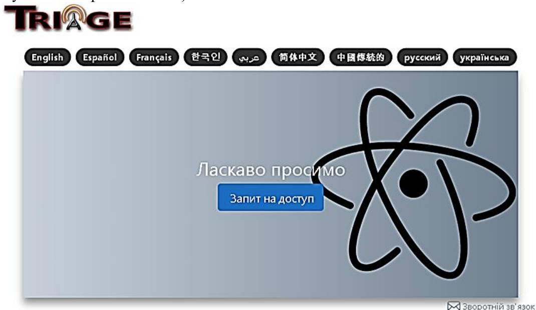
Рисунок 2 Веб-сайт системи “Triage” Департаменту енергетики Національної адміністрації ядерної безпеки Сполучених Штатів Америки (DOE/NNSA).

обладнанням виявлення та ідентифікації радіаційних та ядерних матеріалів, навчання, оснащення та експертна підтримка з боку DOE/NNSA українських фахівців з підрозділів виявлення та розмінування, що можуть зіткнутися з радіаційними або ядерними загрозами (поводження з компонентами радіологічної зброї, компонентами ядерних боєприпасів що не вибухнули, роботу на радіоактивно-заражених ділянках місцевості, а також поведження з джерелами іонізуючого випромінювання).